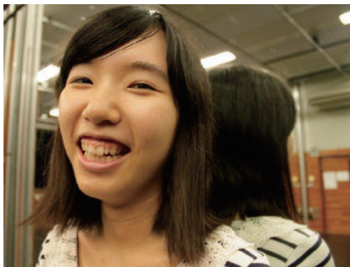
多摩美映像演劇学科一年（多摩美術大学） 『燃やす』

地方自治体による学生演劇祭というこの新たな試みの始まりに、全国各地の学生の皆様、また学生でない皆様も、是非お立会いください。