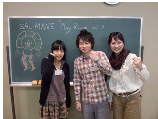
SAL-MANE（東京学芸大学） 『インプロ（即興）×西和賀』（仮）

東日本大震災は私たちにとって何だったのか。東京で遭遇した私たちはどう受け止めるべきなのか。文字・映像・音楽・身体表現によるパフォーマンス。