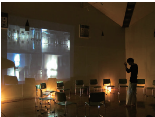
HOME（日本大学芸術学部） 『You are Nobody! Who am I?』

焦げ臭い部屋で眠気の失せた3人は、外で夜中に「あたしの気持ちがわかるのかー！」と叫ぶ自転車通り魔をよそに、一家の今後を考えた。